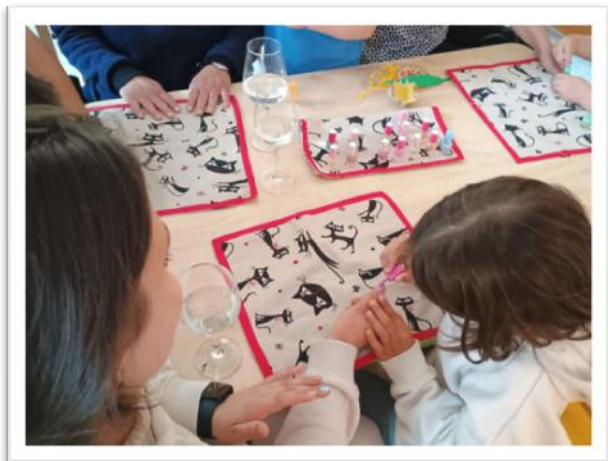
Wellness odpoledne pro maminky